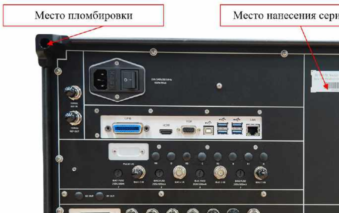
Рисунок 2 - Схема пломбировки от несанкционированного доступа и место нанесения серийного номера, идентифицирующего каждый экземпляр СИ

Заявитель ООО «НПК «ЭОМС», генеральный директор Испытатель ФБУ «Ростест-Москва», главный специалист по метрологии